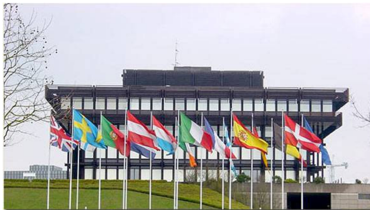
Het gebouw in Luxemburg waar het Europees Hof van Justitie zetelt.

Als er landen, bedrijven of EU-burgers zijn die de wet niet toepassen, dan kan de Commissie ze voor het Europees Hof van Justitie dagen. De Europese rechters zullen dat land een zware boete opleggen. Tabaksbedrijven die geen waarschuwing op hun pakjes drukken, moeten zeker voor het Europees Hof van Justitie verschijnen.