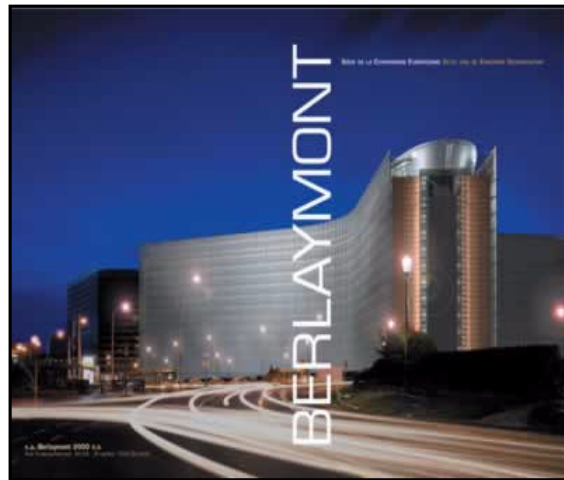
Het Berlaymont-gebouw waar de Commissie vergadert.

Als er een Europese wet moet gemaakt worden, start alles bij de Europese Commissie . Er zijn zevenentwintig commissarissen voor de hele EU. Elke lidstaat heeft er één, maar ze mogen niet aan het belang van hun eigen land denken. Ze moeten werken voor alle Europese lidstaten samen. Die commissarissen hebben elk een eigen domein waarvoor ze verantwoordelijk zijn. Als zij bijvoorbeeld vinden dat op elk pakje sigaretten een gezondheidswaarschuwing moet staan, dan maken zij daarover een “wetsvoorstel”. In dit geval moet de Commissaris voor volksgezondheid dat doen.