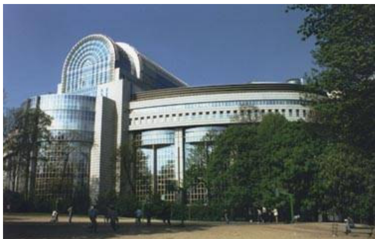
Het Europees Parlement.

Dit voorstel gaat dan naar het Europees Parlement . Dat zijn 785 mensen, die de inwoners van de EU vertegenwoordigen. De leden van het Europees Parlement worden om de vijf jaar door de Europeanen verkozen. Het Europees Parlement komt samen in Straatburg en in Brussel. Ze bekijken het wetsvoorstel van de Commissie en geven er hun mening over.