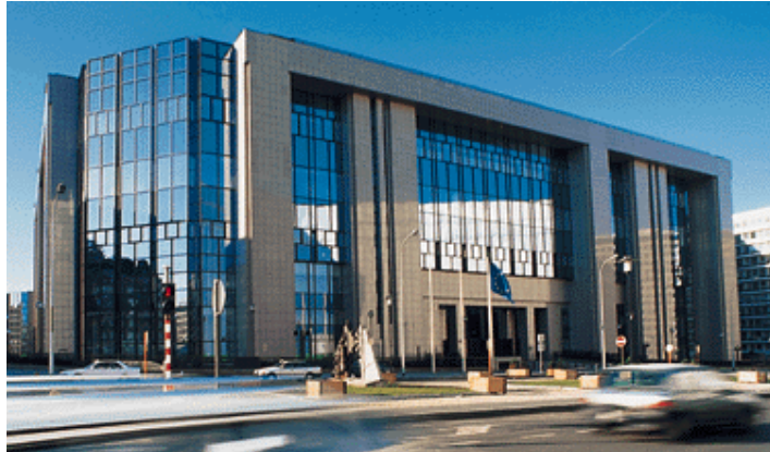
Het Justus-Lipsius gebouw of Consilium waar de Ministerraad vergadert.

Als het Europees Parlement akkoord gaat met het voorstel om op elk pakje sigaretten een waarschuwing te plaatsen, mag het voorstel naar de Europese Ministerraad . Dat zijn de ministers van alle landen van de EU die geregeld bijeen komen. Natuurlijk komen ze niet telkens allemaal samen. Als er iets moet besproken worden over varkens en koeien, dan vergaderen de ministers van Landbouw, gaat het over geld dan zijn de ministers van Financiën er, enz. Voor het voorstel van de sigarettenverpakking zullen alle ministers van Volksgezondheid samenkomen.